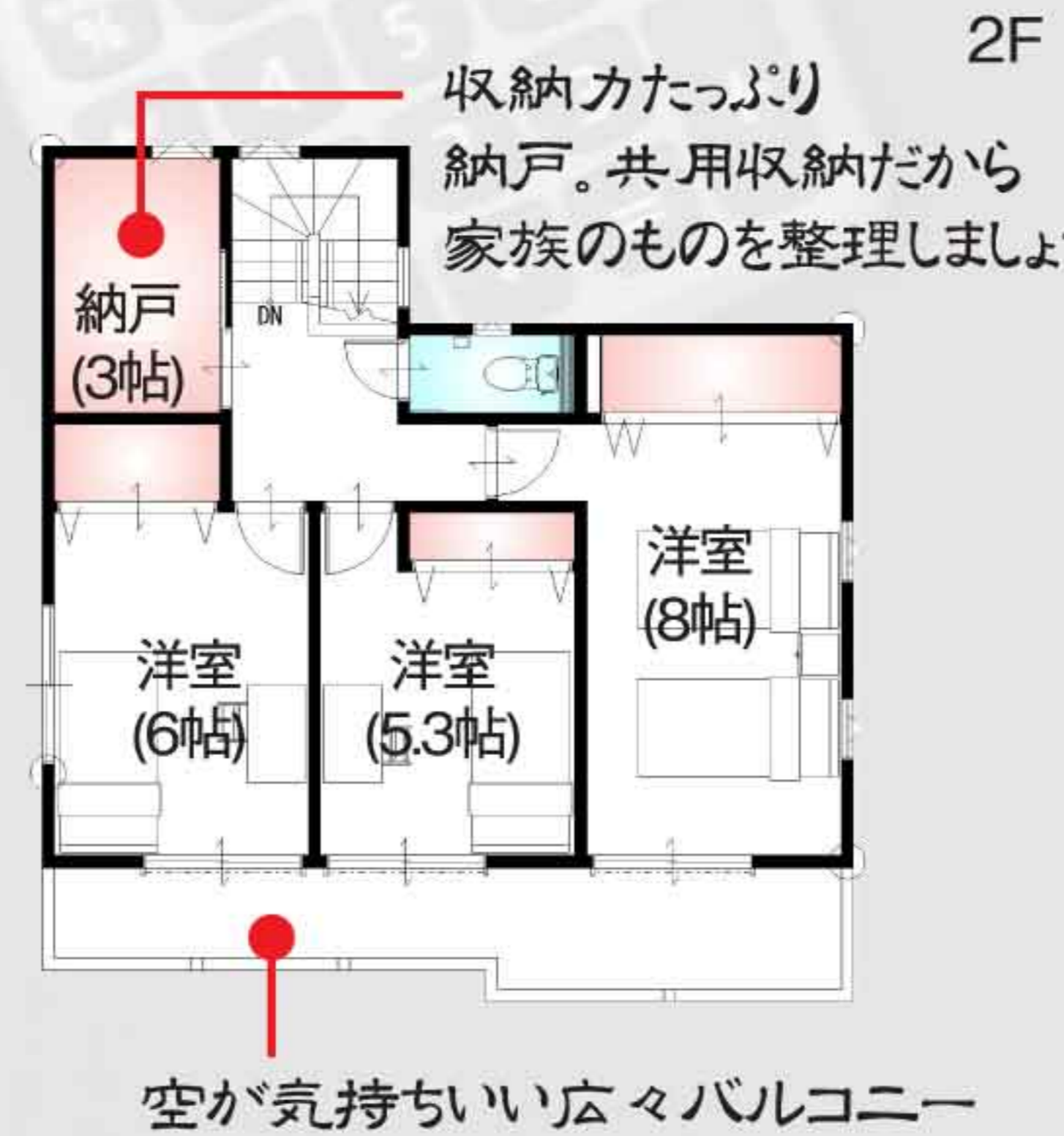
『奥様にやさしい家事動線の住まい♪』