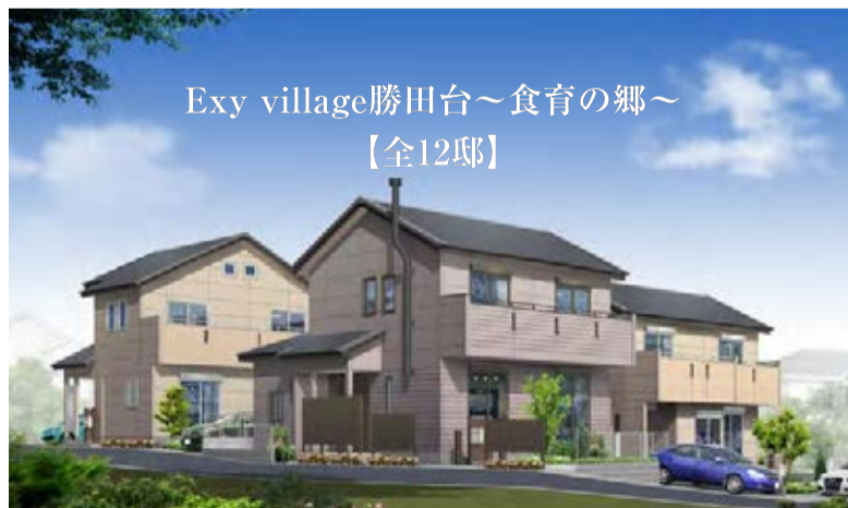
Exy village勝田台～食育の郷～ 【全12邸】