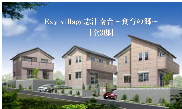
Exy village志津南台～食育の郷～ 【全3邸】