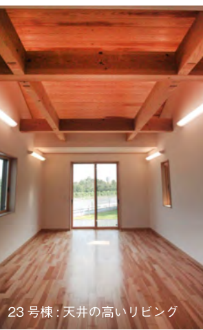
23号棟: 天井の高いリビング