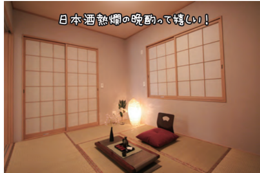
日本酒熱燗の晩酌って嬉しい!