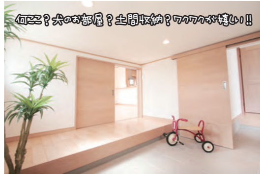
何ぞ? 犬のお部屋? 玄関収納? ワカワカが嬉しい!!