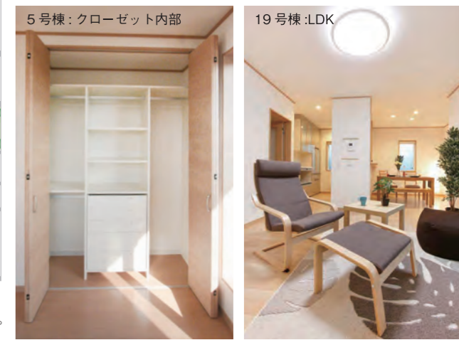
5号棟: クローゼット内部