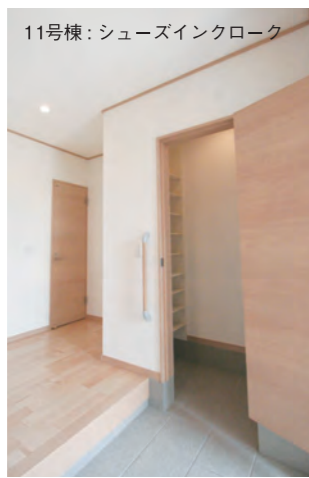
11号棟: シューズインクロー