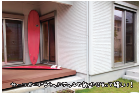
サーフボードをカウチで乾かせるので嬉しい!