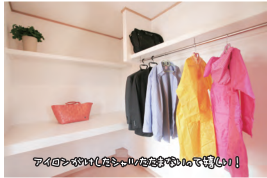
アイロンがけしたシャツはたまごの形で嬉しい!