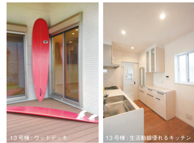
13号棟: ウッドデッキ