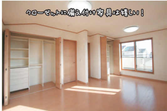
クローゼットに備え付け家具は嬉しい!