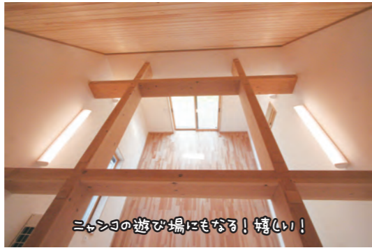
ニャンコの遊び場にもなる! 嬉しい!