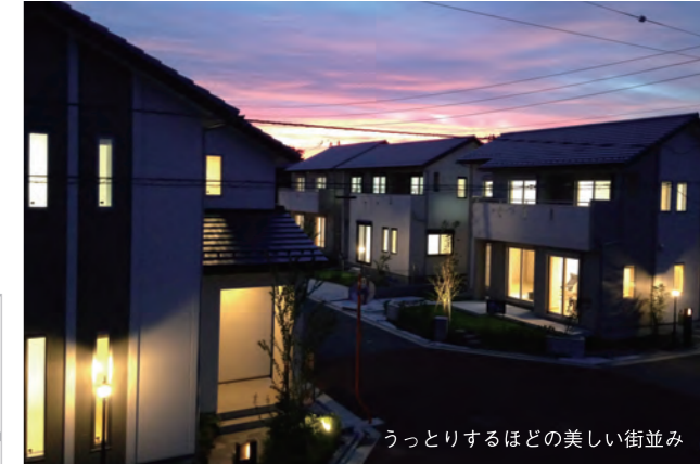
うっとりするほどの美しい街並み